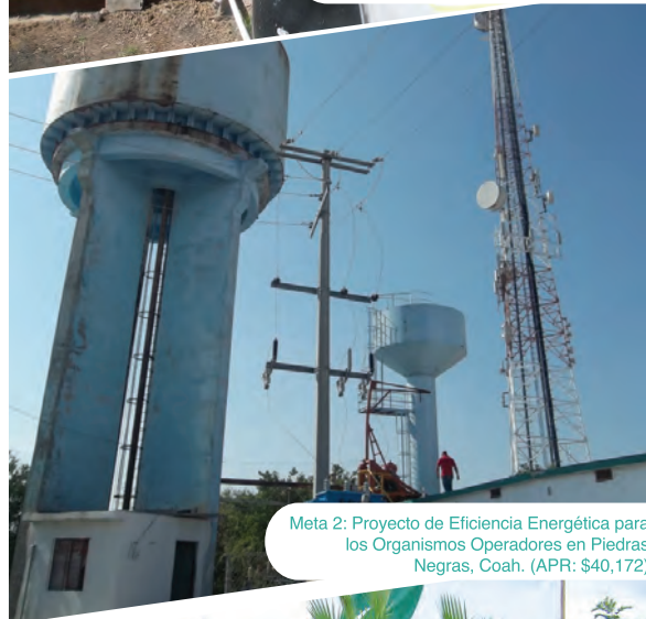
Meta 2: Proyecto de Eficiencia Energética para los Organismos Operadores en Piedras Negras, Coah. (APR: $40,172)