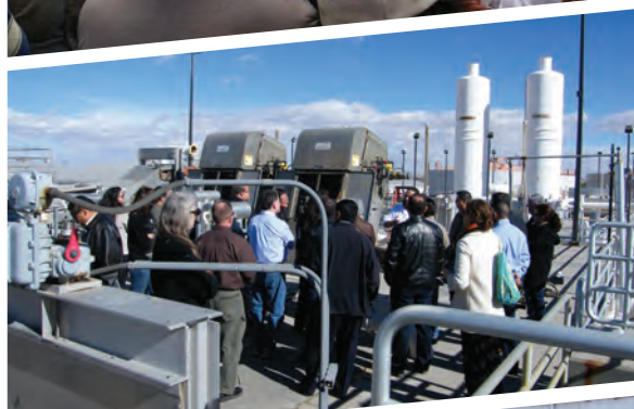
Recorrido a la Planta de Tratamiento de Aguas Residuales "Bustamante"