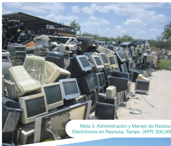
Meta 3: Administración y Manejo de Residuos Electrónicos en Reynosa, Tamps. (APR: $30,000)

Prácticas empresariales sustentables mediante el establecimiento de Sistemas de Manejo Ambiental en Tijuana y Mexicali, BC (APR: $66,576)