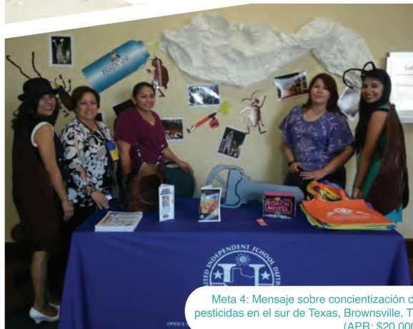
Meta 4: Mensaje sobre concientización de pesticidas en el sur de Texas, Brownsville, TX (APR: $20,000)