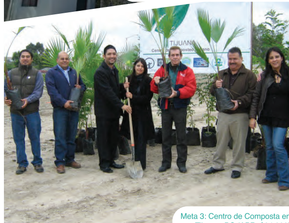
Meta 3: Centro de Composta en Tijuana, BC (APR: $94,000)