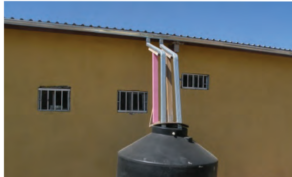
Meta 1: Proyecto de Conservación de Agua en Palomas, Chih. (APR: $10,000)

Monitoreo de sedimento y escurrimientos en el Cañón de Los Laureles para apoyar su modelación y gestión en Tijuana, BC (APR: $16,000)