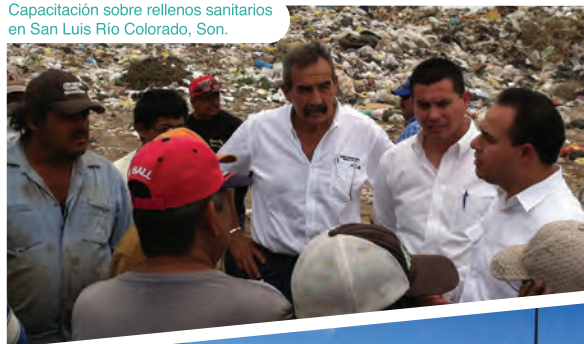
Capacitación sobre rellenos sanitarios en San Luis Río Colorado, Son.