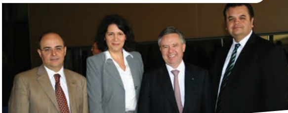
Sesión informativa conjunta con el Embajador de Estados Unidos en México