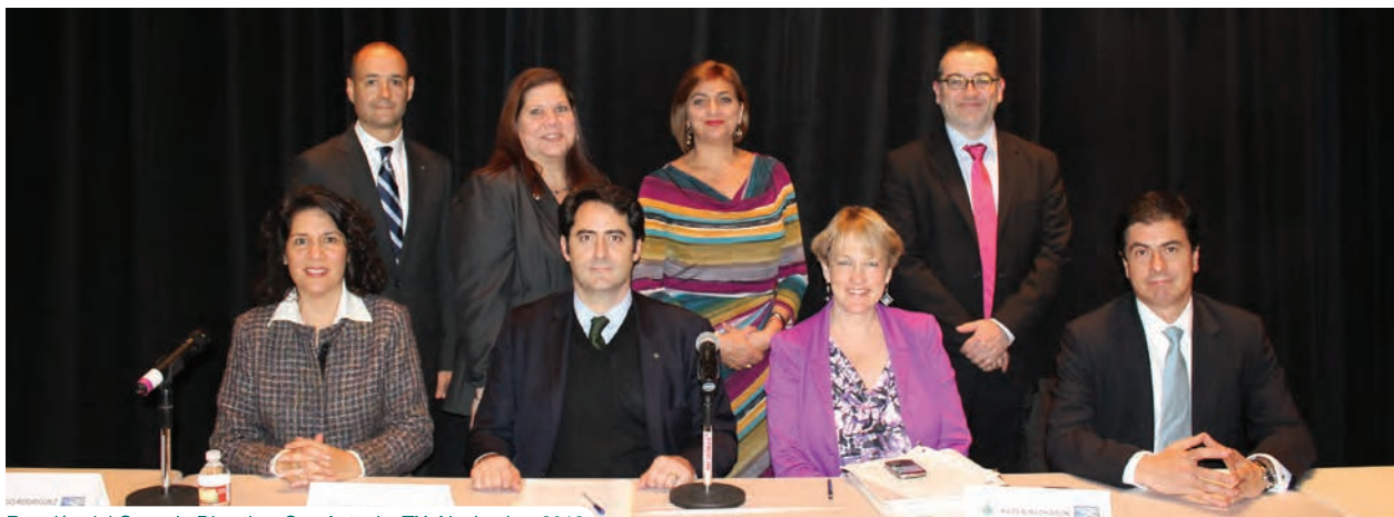
Reunión del Consejo Directivo, San Antonio, TX. Noviembre 2013