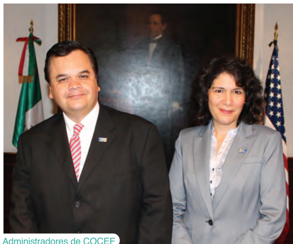
Administradores de COCEF

Durante el 2013, la COCEF certificó 19 proyectos de infraestructura ambiental. Destacan el primer proyecto de generación de biogas en un relleno sanitario en Saltillo, Coahuila, así como el primer proyecto transfronterizo de energía eólica en California y Baja California. La COCEF también aprobó más de $2.4 millones de dólares en subsidios de asistencia técnica para apoyar el desarrollo de proyectos en 15 comunidades fronterizas. En el área de fortalecimiento de capacidades, la COCEF apoyó el desarrollo de Planes Estatales de Acción Climática en los estados de Baja California, Tamaulipas, Coahuila y Chihuahua, y colaboró con la Agencia para el Desarrollo Internacional (por sus siglas en inglés USAID) y la Agencia de Protección Ambiental de Estados Unidos (EPA, por sus siglas en inglés), así como con entidades estatales y locales, para llevar a cabo auditorías energéticas en 10 organismos operadores de servicios de agua y alcantarillado en comunidades fronterizas mexicanas y estadounidenses. Estos y otros logros del ejercicio se detallan a lo largo de este informe anual.