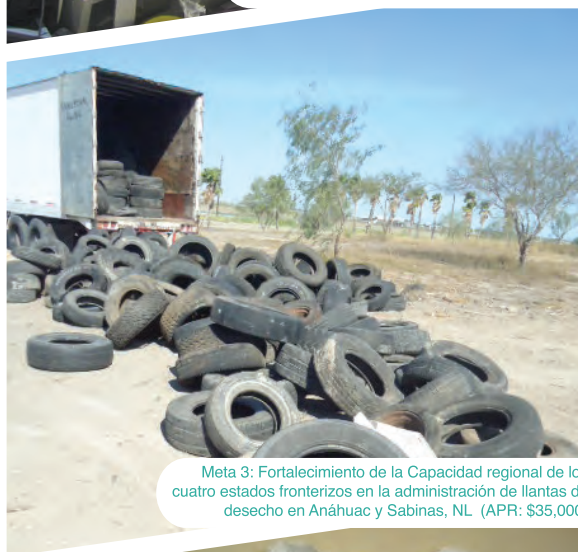
Meta 3: Fortalecimiento de la Capacidad regional de los cuatro estados fronterizos en la administración de llantas de desecho en Anáhuac y Sabinas, NL (APR: $35,000)