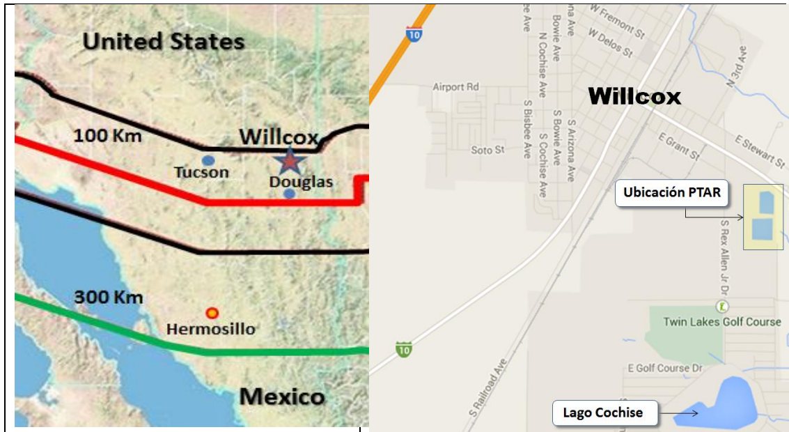
Figura 1 MAPA DE UBICACIÓN DEL PROYECTO