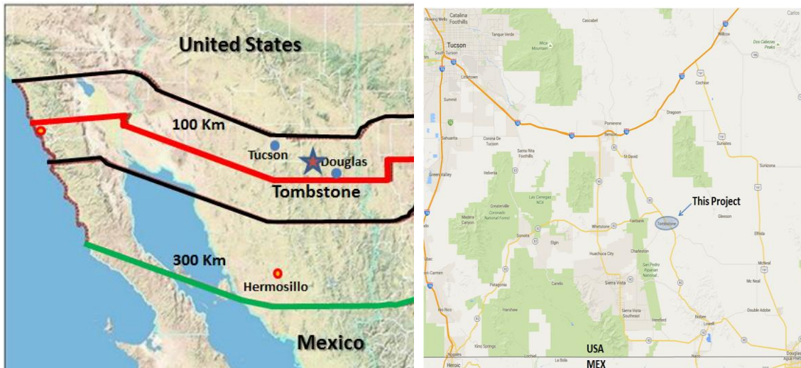
Figura 1 MAPA DE COLINDANCIAS DEL PROYECTO