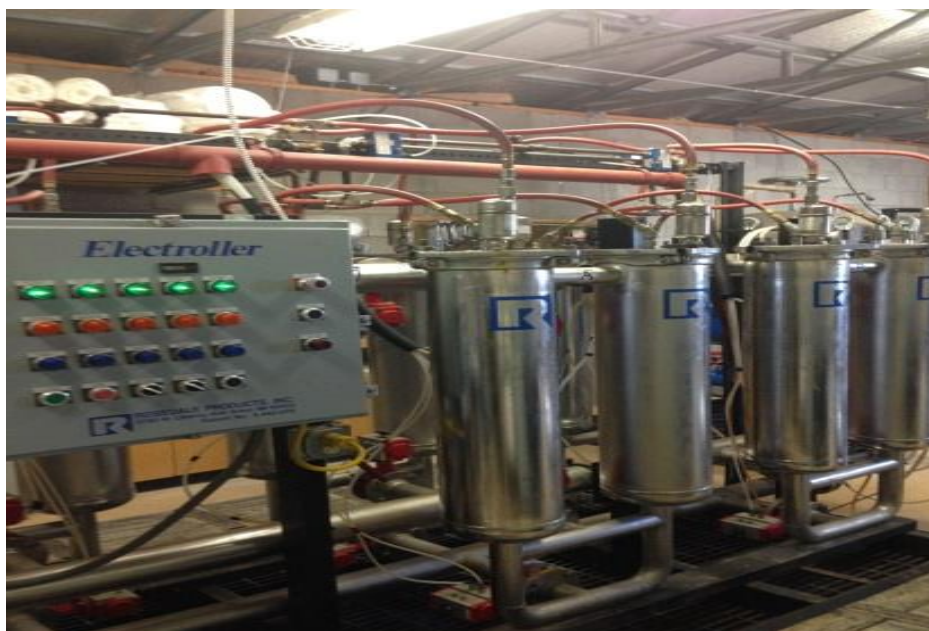
La ciudad de Tombstone puso en funcionamiento la PFAS el 21 de diciembre de 1998 (fotografía tomada en marzo de 2015).

de 100,000 galones (378.5 m 3 ) y 300,000 galones (1,136 m 3 ), respectivamente. Estos tanques retienen el agua filtrada y clorada para consumo.