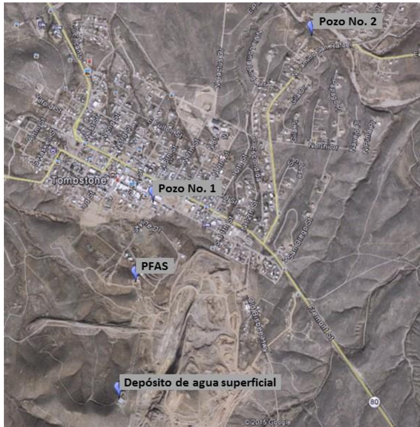
Figura 2 UBICACIÓN DE LA INFRAESTRUCTURA DEL SISTEMA DE AGUA POTABLE

PFAS = Planta de filtración de agua superficial