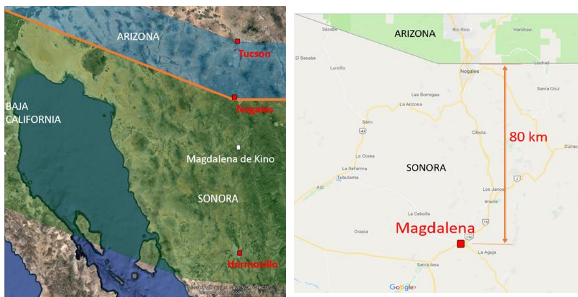
Figura 1 MAPA DE UBICACIÓN DEL PROYECTO