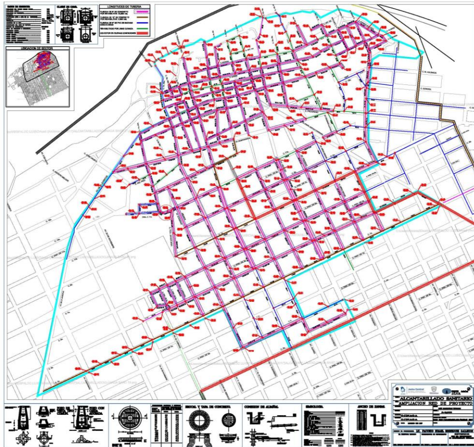
Figura 2 PROYECTO DE REHABILITACION DEL ALCANTARILLADO EN OJINAGA

Los fondos BEIF se utilizarán para la rehabilitación del sistema de alcantarillado sanitario, así como para los servicios de supervisión para todas las actividades de construcción. Los recursos mexicanos se utilizarán para obras similares y se espera que se inviertan ligeramente después de los recursos del BEIF. La construcción general del Proyecto se dividirá en tres paquetes de licitación, de tamaño similar, dos de los cuales se pagarán con recursos mexicanos asignados durante dos años fiscales y el tercer paquete contará con el apoyo de recursos del BEIF.