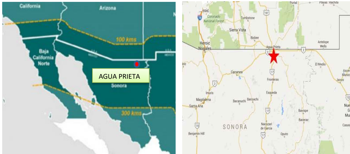
Figura 1 MAPA DE UBICACIÓN DEL PROYECTO