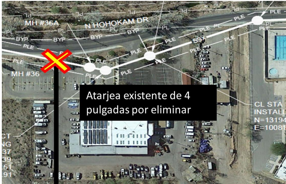
Figura 3 ESTACIONAMIENTO DEL DEPARTAMENTO DE OBRAS PUBLICAS DE LA CIUDAD DE NOGALES