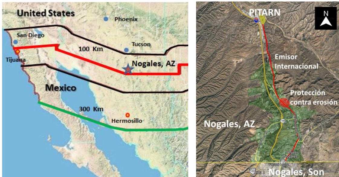
Figura 1 MAPA DE UBICACIÓN DEL PROYECTO