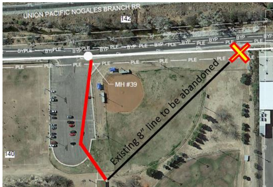
Figura 4 CAMPO DE BÉISBOL “FLEISCHER PARK”