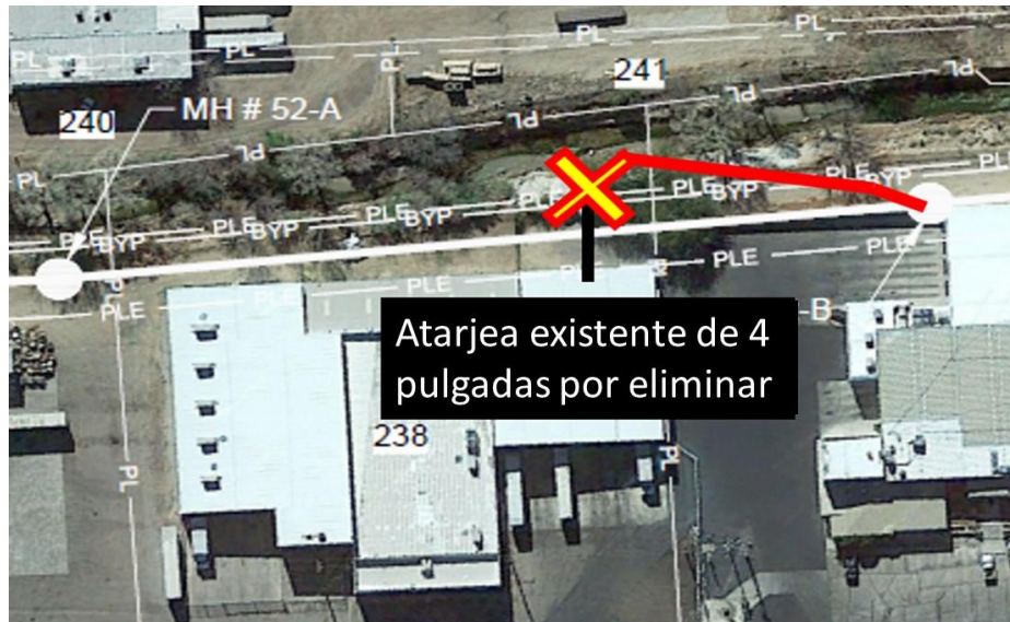
Figura 6 ALMACÉN CHAMBERLAIN

Asimismo, se implementarán medidas de protección contra la erosión de las orillas del arroyo Nogales que se encuentran cerca del puente Produce Row. El trabajo consiste en instalar escolleras o enrocado con mortero en áreas críticas a lo largo de la margen oriente del arroyo que podrían poner en peligro la infraestructura del emisor y de la tubería principal de agua potable de la ciudad, que da servicio a casi el 50% de la población. Se requiere protección adicional a lo largo del margen poniente para evitar la migración lateral dentro del área del Proyecto. La longitud total de este componente es de aproximadamente 2,000 pies (610 m), como se muestra en la Figura 7.