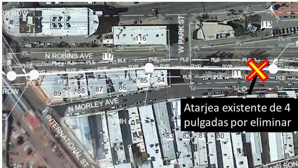
Figura 2 BAÑOS DE LA ESTACIÓN HISTÓRICA DE FERROCARRIL