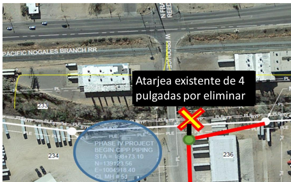
Figura 5 WEST PRODUCE ROW