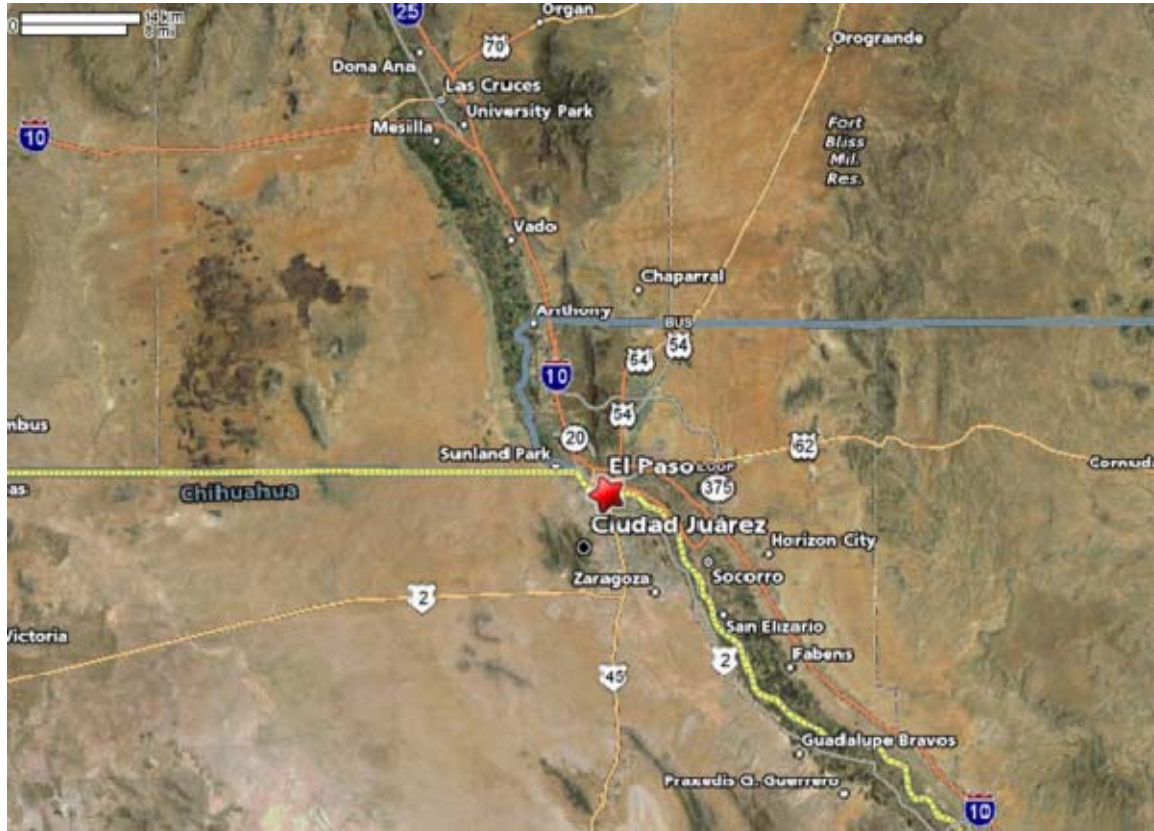
Figura 1.1 Ubicación de El Paso, Texas.