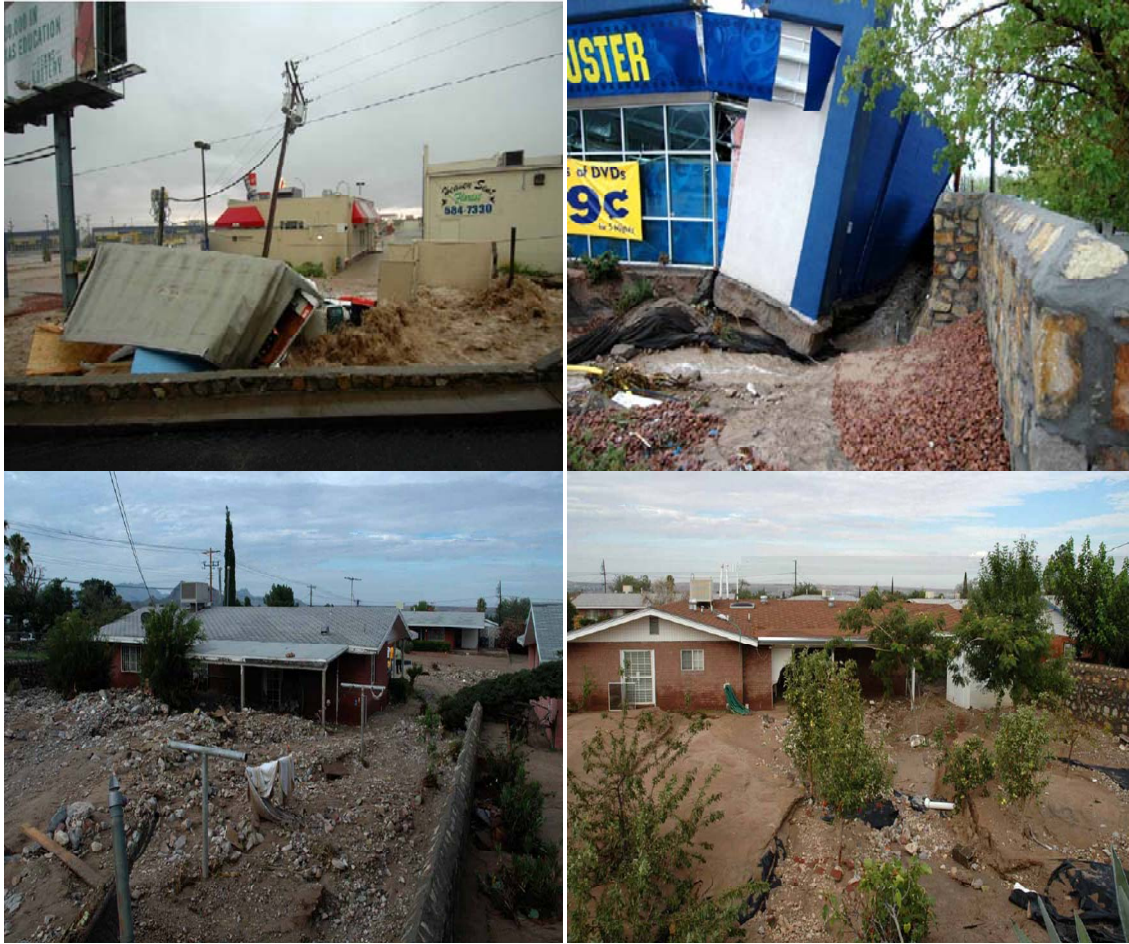
Figura 1.3 Impactos de la Tormenta del 2006.