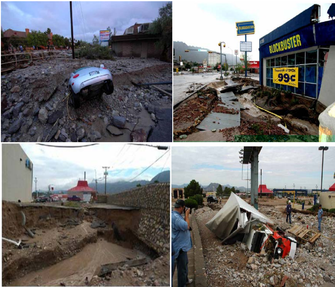
Figura 2.1 Desastres de la Tormenta del 2006