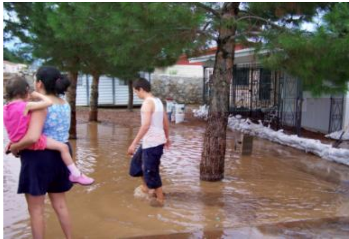
Figura 1.4 Agua pluvial estancada contaminada.

La imagen 1.4 ilustra agua pluvial estancada contaminada como resultado del sistema inadecuado de drenaje pluvial.