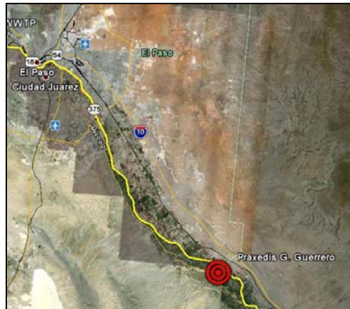
Figura 1. Localización de Praxedis G. Guerrero en el Municipio de Praxedis G. Guerrero