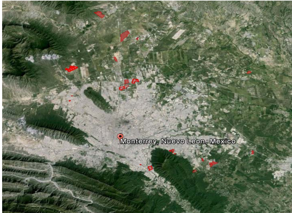
Figura 2 UBICACIÓN DEL PROYECTO

El Departamento de Obras Públicas del Estado de Nuevo León ha coordinado todas las obras de pavimentación con SADM y los departamentos de Desarrollo Social municipales para garantizar que todas las zonas seleccionadas para nueva pavimentación cuentan ya con la infraestructura de agua potable y aguas residuales, antes del inicio de las obras de pavimentación. Los fondos asignados a este Proyecto podrán ser utilizados para la terminación de infraestructura hidráulica, en caso de que así lo requiera alguna zona incluida en el alcance del Proyecto.