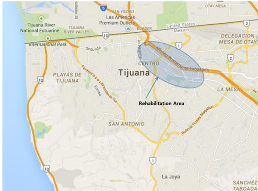
La Figura 3 muestra la localización de los componentes del proyecto de conexiones en las colonias Maclovio Rojas, Ojo de Agua y Lomas del Valles en la ciudad de Tijuana, Baja California.