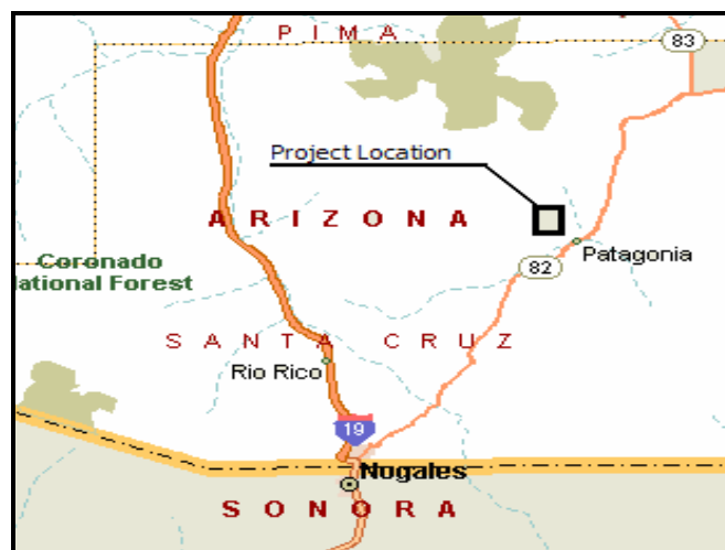
Figura 1 - Patagonia, Arizona

El proyecto se implementará en la ciudad de Patagonia, que se encuentra a 24 km. al norte de la frontera entre los EUA y México, en el condado de Santa Cruz, en el sur de Arizona. La ciudad de Patagonia se encuentra a una altitud de 1,232 msnm en un valle rodeado por las montañas Santa Rita al norte y las montañas Patagonia al sur. La ciudad se fundó en 1898 y se rige por la forma de gobierno de alcaldía. La Figura 1 muestra la ubicación general de la ciudad de Patagonia, dentro del estado de Arizona y su ubicación con la frontera con México.