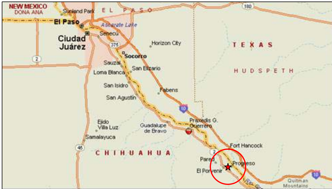
Figura 1. Localización de El Porvenir en el Municipio de Praxedis G. Guerrero.