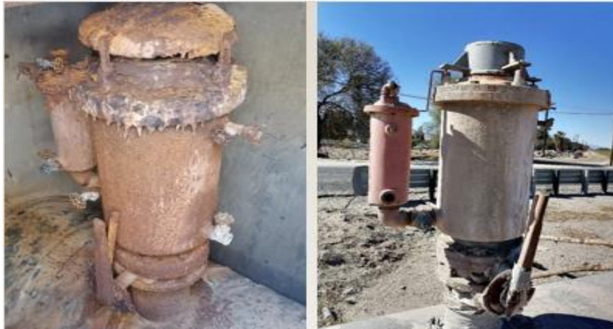
Figura 2 CONDICIONES ACTUALES DE LAS VÁLVULAS AUTOMÁTICAS DE EXPULSIÓN DE AIRE

Estas obras son necesarias para proteger la salud pública y el medio ambiente, ya que permitirán minimizar el riesgo de rupturas en las tuberías que pueden provocar el desbordamiento de aguas residuales hacia las calles de la localidad y al río Nuevo, que fluye en dirección norte hacia Estados Unidos. Es por ello que el Proyecto fue priorizado para su financiamiento a través del Programa de Infraestructura Hídrica Fronteriza México-Estados Unidos de la Agencia de Protección Ambiental de Estados Unidos (EPA, por sus siglas en inglés).