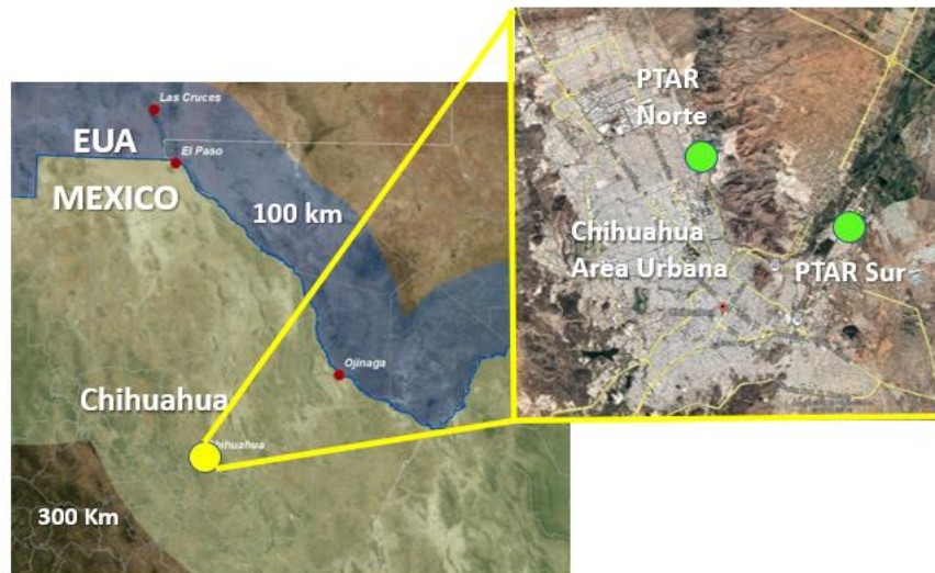
Figura 1 MAPA DE UBICACIÓN DEL PROYECTO

El Proyecto incluye la rehabilitación/modernización, operación y mantenimiento de las PTARs Norte y Sur. La planta Norte está localizada al noreste del área urbana en las siguientes coordenadas: 28° 41' 51.09" de latitud norte y 106° 04' 60" de longitud oeste. La planta Sur se encuentra al este de la ciudad en las siguientes coordenadas: 28° 40' 08" de latitud norte y 106° 00' 18" de longitud oeste. La Figura 1 muestra la ubicación geográfica del Proyecto.