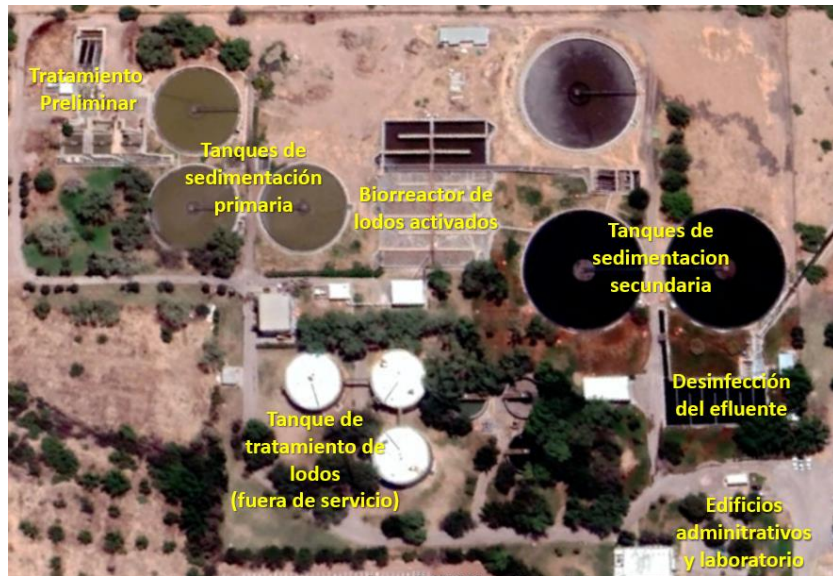
Figura 4 PTAR SUR. PROCESO DE TRATAMIENTO